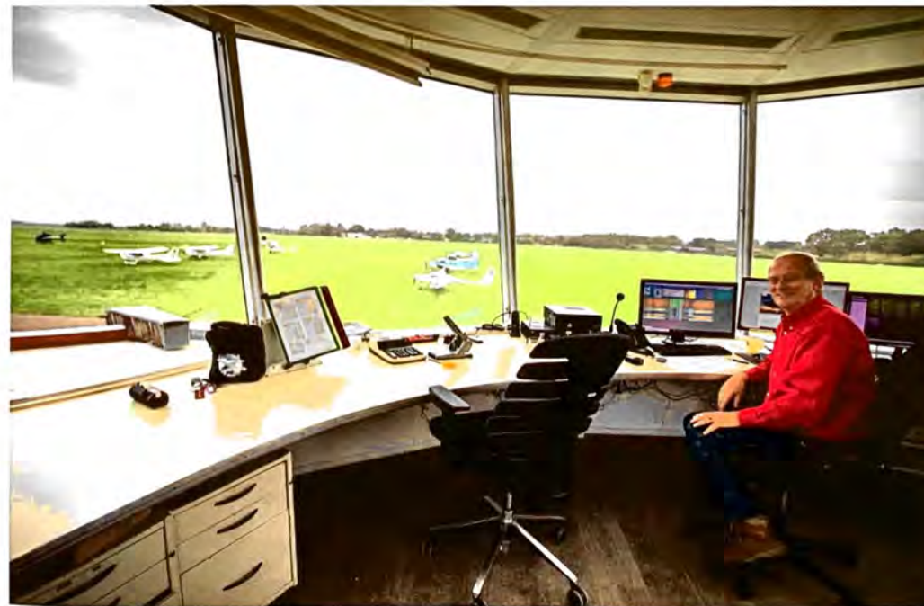
Mooi uitzicht over het veld.

Het bestuur wil graag dat de leden zelf zoveel mogelijk activiteiten organiseren. 'Je