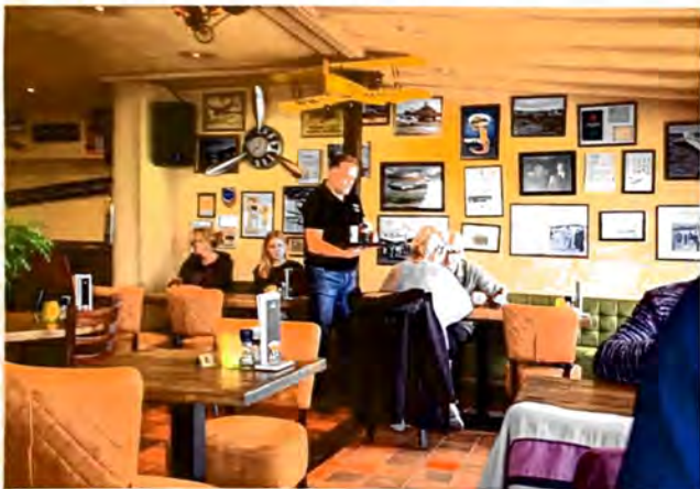
De ACHA is eigenaar van het pand waarin het vliegveldrestaurant is gevestigd. Het restaurant bloeit als nooit te voren. Een mooie kaart, goede producten, cateringactiviteiten, organisatie van feesten en partijen etc.